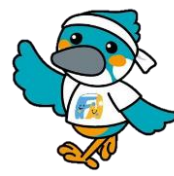
かわせみ体操イメージ キャラクター 「かわせみくん」