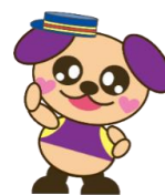
藤沢市保健医療財団 イメージキャラクター 「サボ犬」